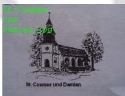
Bild 3 Kirche Zeichnung Zeichner unbekannt Von Edy Majerus zur Verfügung gestellt