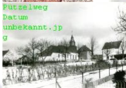
Bild 2 Kirche mit Pfarrhaus und Schule vom Pützelweg aus fotografiert.